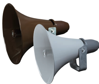
●防災行政無線用レフレックスホーンスピーカー